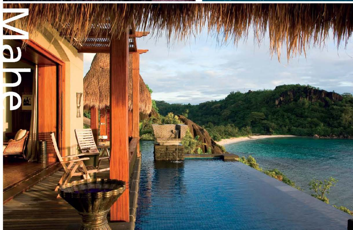
Banyan Lagoon 1